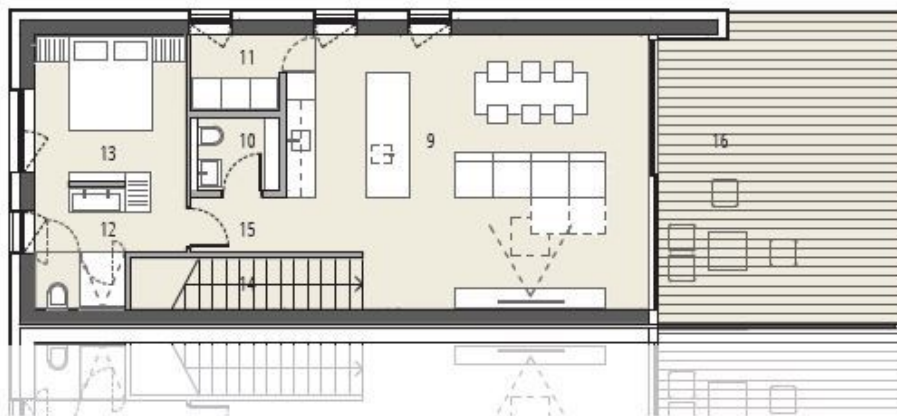
Tloris terasne etaže