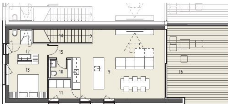
Tloris terasne etaže