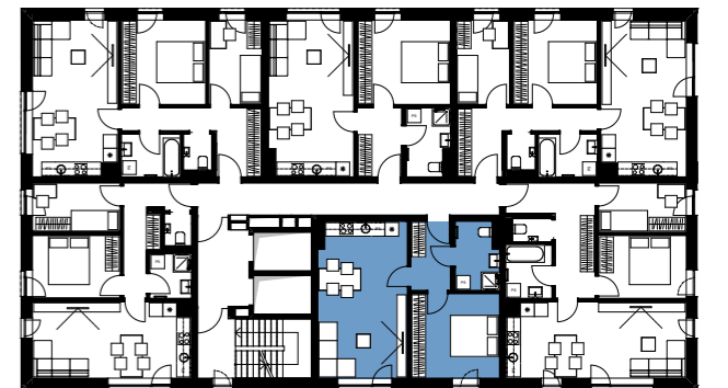
Položaj stanovanja v etaži