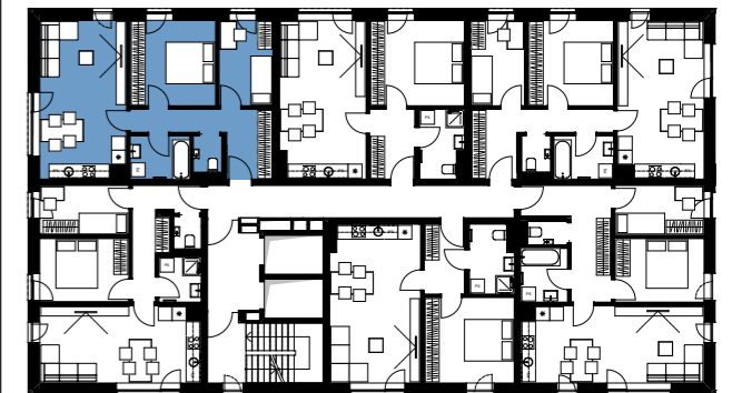
Položaj stanovanja v etaži