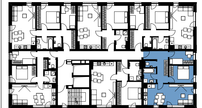
Položaj stanovanja v etaži