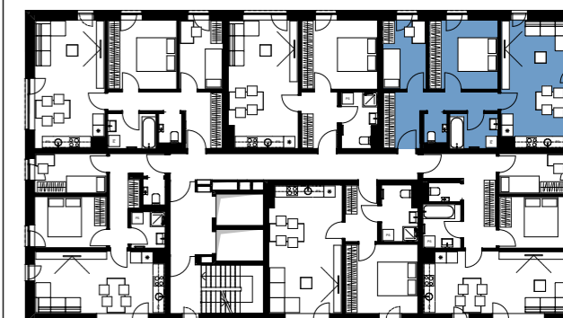
Položaj stanovanja v etaži