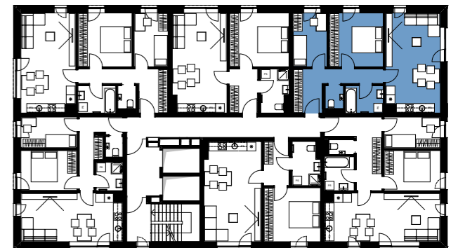
Položaj stanovanja v etaži