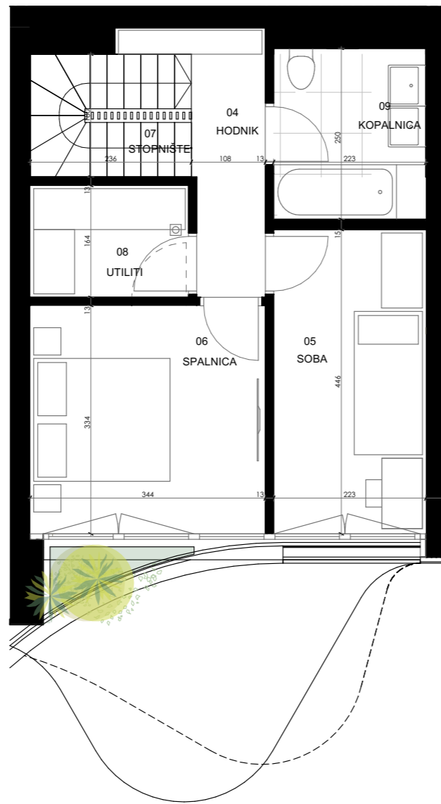
DRUGI NIVO STANOVANJA (ČETVRTA ETAŽA)