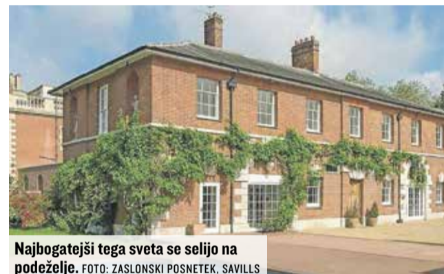
Najbogatejši tega sveta se selijo na podeželje.

»Ker se je povpraševanje po klasičnih stanovanjskih