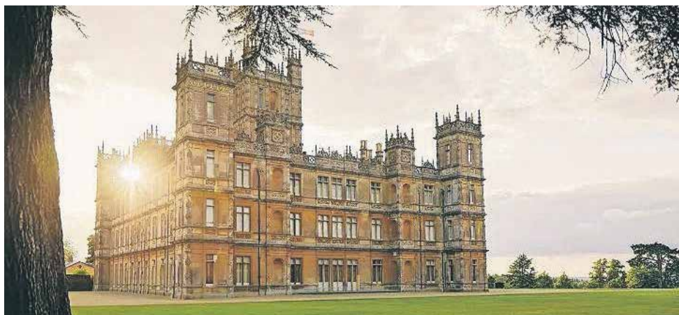
V Veliki Britaniji se kot za med prodajajo grajske posesti, ki so bile več stoletij v lastništvu ene družine. Kupujejo jih najbogatejši z vsega sveta, ki so pred korono kupovali jahte in luksuzna stanovanja v nebotičnikih. (Na fotografiji Downton Abbey.)

jih zaznavajo ponekod v tujini, ni, je verjetno več. Ne nazadnje je podeželje pri nas streljaj od mestnih središč, ki pa imajo v svoji bližini tudi sprehajalne poti. Ljudje se lahko umaknejo tudi v svoje počitniške hišice in teh v Sloveniji ni malo. NINA ČAKARIČ