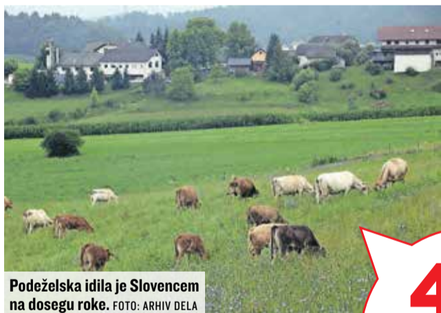
Podeželska idila je Slovencem na dosegu roke.

sti, ki so bile več sto let v lasti aristokratov in grofov, zdaj pa si želijo živeti kot v kulturni zgodovinski seriji Downton Abbey. Da se je povečalo povpraševanje po podeželju, opažajo tudi slovenski nepremičninski agenti, le da kupci pri nas iščejo zazidljiva zemljišča in hiše, ki so bolj nižjega in srednjega cenovnega razreda.