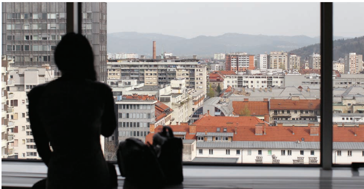
Pred gospodarsko krizo, ki je nastopila leta 2008, so cene nepremičnin letele v nebo. Nato je sledilo strmoglavljenje. Danes se ponekod cene bližajo predkrizni ravni.