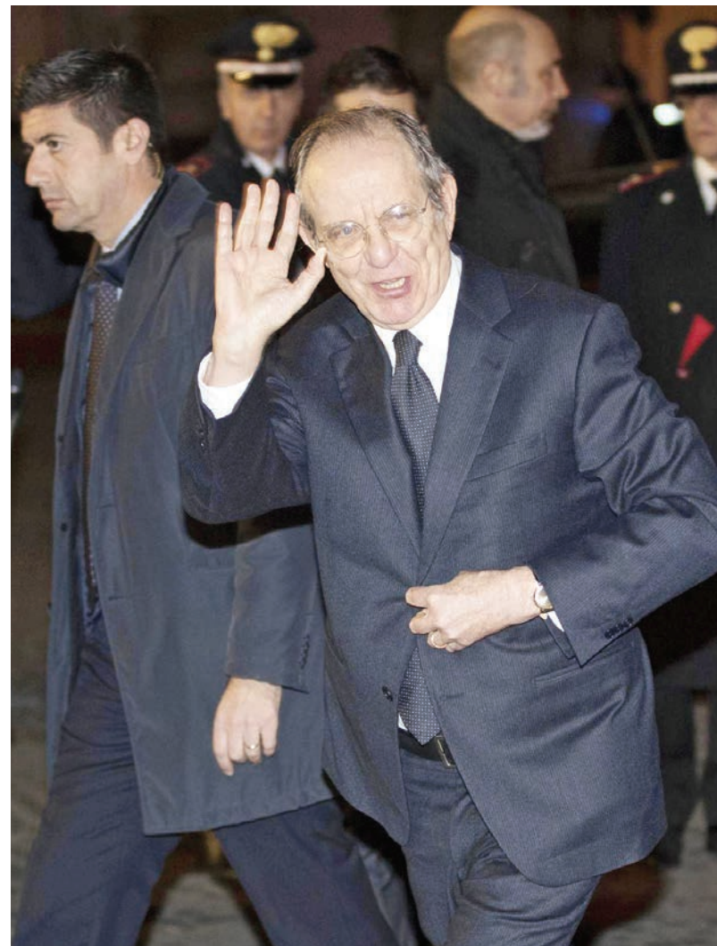
Italijanska vlada, na posnetku je finančni minister Padoan, odločno nasprotuje izbrisu podrejenih obveznic.

povedal finančni minister Pier Carlo Padoan . Načrt italijanske vlade je, da bi lastnikom podrejenih obveznic omogočili pretvorbo obveznic v delnice, te pa bi nato pretvorili v običajne obveznice, ki jih v skladu z evropskimi pravili ni treba izbrisati. Trgovanje z delnicami banke Monte dei Paschi je ustavljeno, njihova vrednost pa se je letos do 23. decembra zmanjšala za več kot 85 odstotkov. Italijanski bančni sistem, ki je četrti največji v EU, se že vse od začetka finančne krize sooča s težavami zaradi slabih kreditov in odpisov terjatev. Politiki in finančniki se bojijo, da bi lahko resnejše težave italijanskih bank zamajale celotni evropski finančni sistem, ki se komaj pobira po hudi finančni krizi ob koncu prejšnjega desetletja.