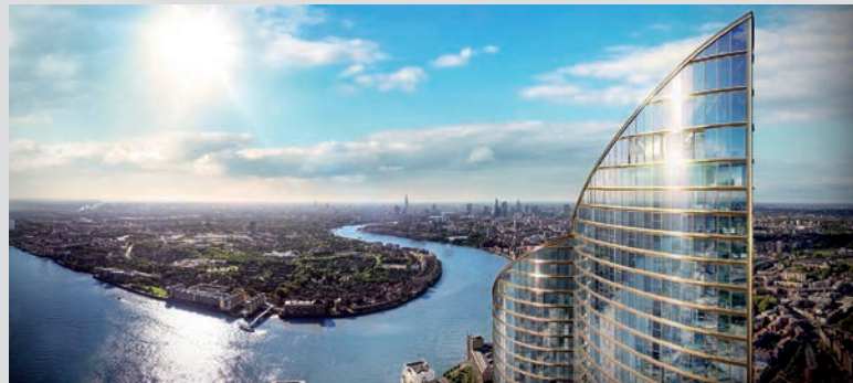
Kitajski investitorji so v Londonu za 800 milijonov funtov zgradili najvišjo stanovanjsko stavbo v zahodni Evropi. 235 metrov je visoka, ima 861 stanovanj.

In koliko kvadratnih metrov stanovanja si lahko omislimo, če imamo 200 tisoč evrov. Najdražja stanovanja so na prodaj v Veliki Britaniji, kjer kupec za 200 tisočakov v povprečju dobi 39 kvadratnih metrov. V Sloveniji za tako vsoto lahko dobimo 118 kvadratnih metrov veliko stanovanje, največ pa v Debrecenu na Madžarskem, kjer lahko kupimo kar 201 kvadratni meter veliko stanovanje.