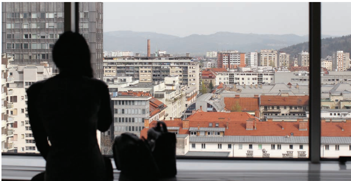
Pred gospodarsko krizo, ki je nastopila leta 2008, so cene nepremičnin letele v nebo. Nato je sledilo strmoglavljenje. Danes se ponekod cene bližajo predkrizni ravni.